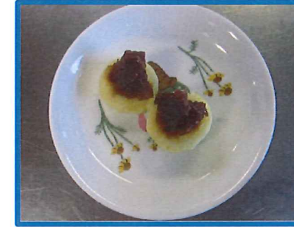
お芋のいい匂いがしてきます!