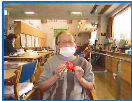
私は赤色で作ったよー♪