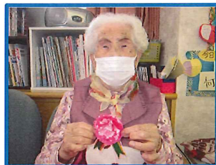
ピンクが色鮮やかでgood!