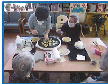
手作りの時間が楽しい♪