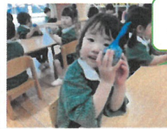
上手にまあくできたかな？