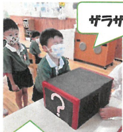
ザラザラしてるぞ