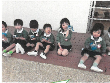
お外でみんなと食べると美味しいね♪

お友達、進級して初めての制服で登園するお友達と、みんな新しい環境で頑張っています。おにぎりやポテトなど、みんなが大好きなおやつを一緒に作り、楽しい雰囲気の中で食べました。特におにぎりピクニックでは、みんなとびきりの笑顔で頑張っていました。