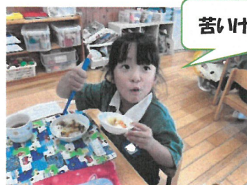
苦いけど美味しい☆