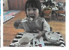
「くくん」なんだこれは?