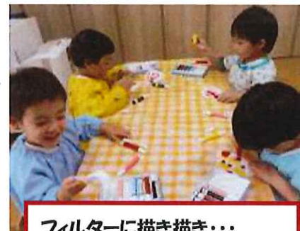
フィルターに描き描き・・・ にじんできて不思議だね！！