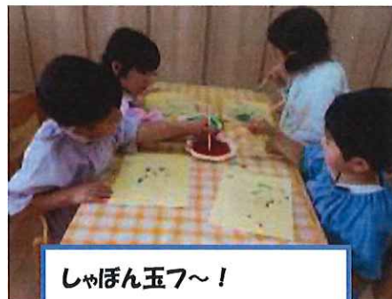
しゃぼん玉フ～！ 「割れて色が出てくるよ！」