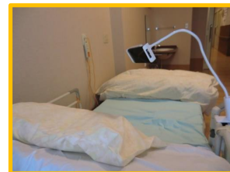
※こちらはイメージ写真になります。