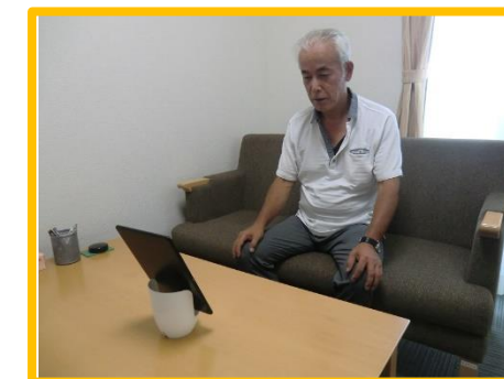
※こちらはイメージ写真になります。

入居者様もご家族と会えず寂しいだけでなく、ご家族様 も心配な毎日をご過ごしているため、5月初旬からテレビ面 会を行っております。