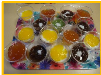
ゼリーも彩りよくきれいですね!