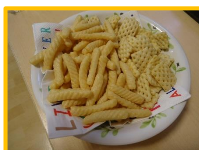
スナック菓子を増やしました!