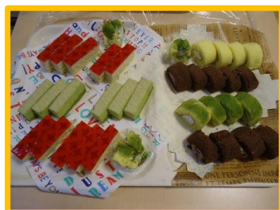
ケーキは別腹で止まらない!?