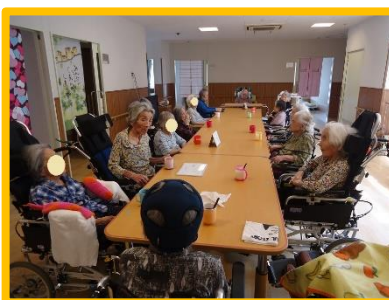
みんなでワイワイガヤガヤ!