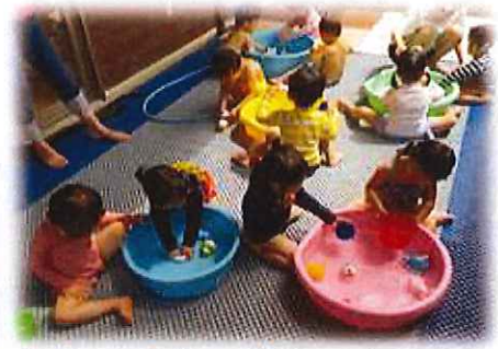
水遊びもたくさんしたよ！冷たいね！