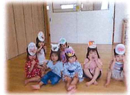
自分で色を塗ったお面を付けて夏祭り会ごっこをしたよ！