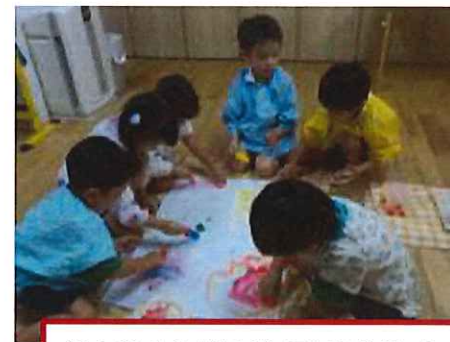
冷たい！色が混ざって綺麗だね！