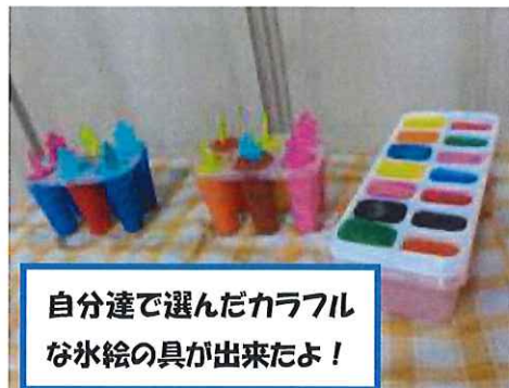
自分達で選んだカラフルな氷絵の具が出来たよ！