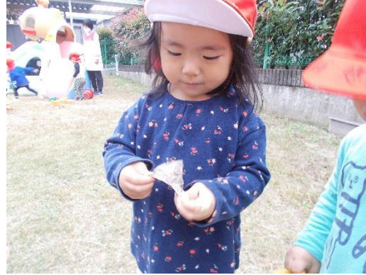
色々な秋を見つけたよ!