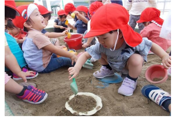
お友達と遊ぶの楽しいな!