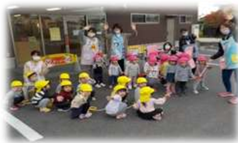
遠足で公園に行ったよ！楽しかったね！