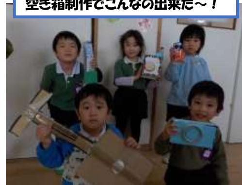
空き箱制作でこんなの出来た~!