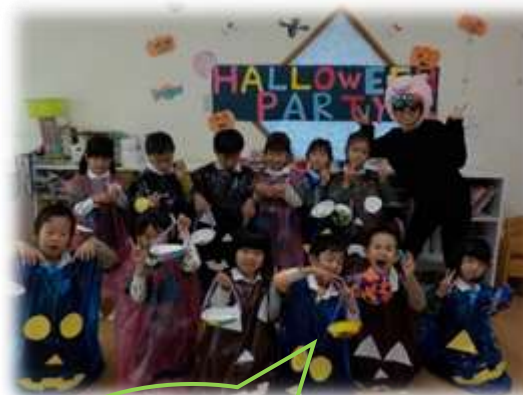
仮装してハロウィンパーティーをしました♪