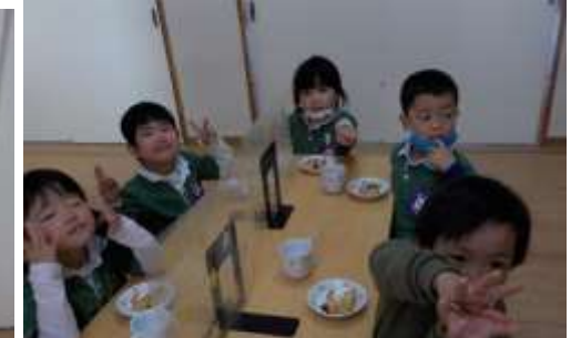
さつまいもドーナツ美味しく出来たね!