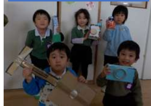
空き箱制作でこんなの出来た~!