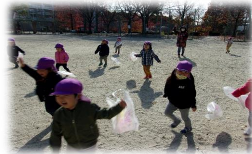
袋に自分たちで好きな色で絵を描き、公園で凧揚げを楽しみました。