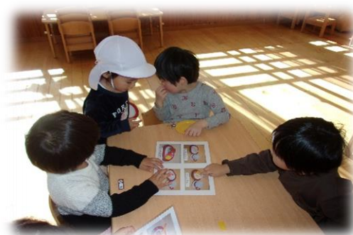
お客さん役とコックさん役に分かれてお店屋さんごっこをしました。白い帽子の子がコックさんです。お客さんはメニューを見ながら「これにする！」と楽しそうに注文し、コックさんはメニュー表を見ながら作ることを楽しんでいました。