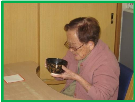
大変おいしゅうございます!

お正月に因んで「書き初め」を行いました。 最初は「20年ぶりだな〜」「習字は難しいな〜」など、 あまり乗り気では無さそうな感じではありましたが、 筆を持つと「久しぶりの習字も楽しいね」と、ご満悦な 様子でした。