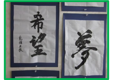
皆さま、とっても上手です!