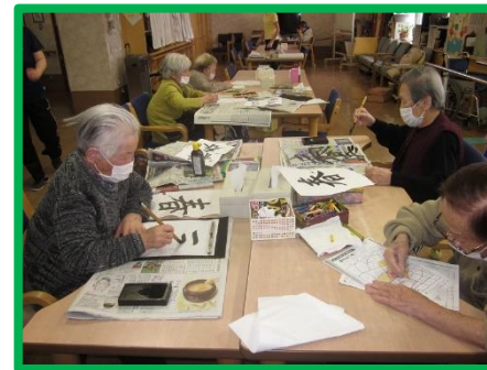
どんどん書いていきます♪