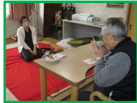
来年はまた園児とお茶を点てたい