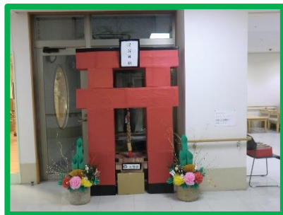
ロビーに突然現れた!?