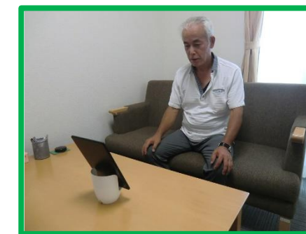
※こちらはイメージ写真になります。

先月に引き続きオンライン面会を継続しております。現在のところは基本、平日の当日予約で自宅もしくは施設の別部屋でテレビ電話をつないでっております。 ※詳細は随時郵送しております。心苦しい部分もございますがご了承いただければ幸いです。 ※情勢に応じて変更の可能性がございます。