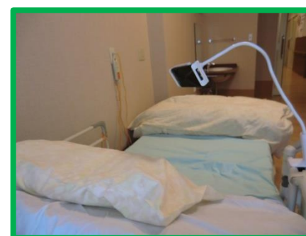
※こちらはイメージ写真になります。