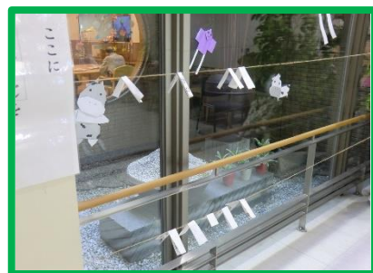
おみくじも吊りました！