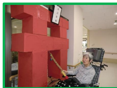
鈴を鳴らし心を和ませます