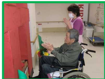
厳かな雰囲気です