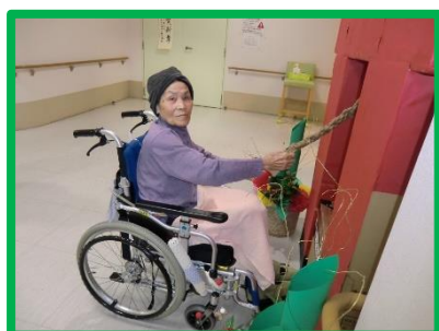
ガラガラ！雰囲気が出てますね