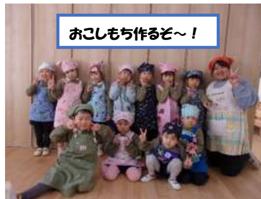
おこしもち作るぞ～！