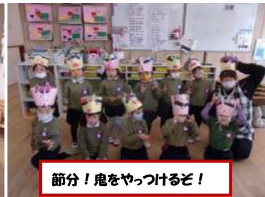
節分！鬼をやっつけるぞ！