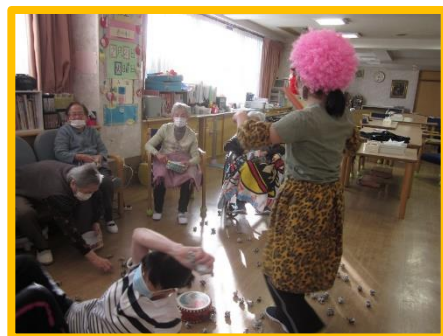
皆さま元気いっぱいです♪