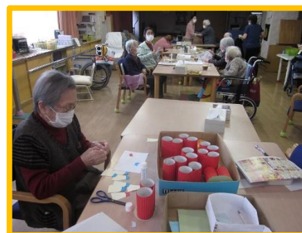
手作りのお祝い品です!