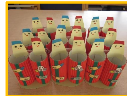
みんなおそろいで使ってね♪