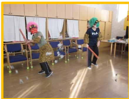
鬼も押され気味です!