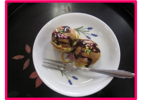
色鮮やかでおいしそう!