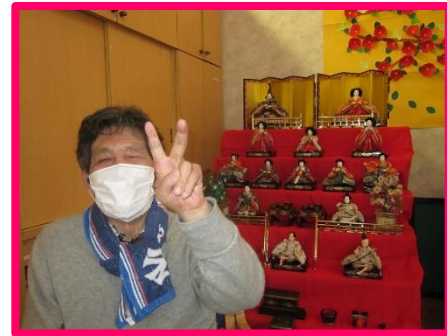
完成して良かった!