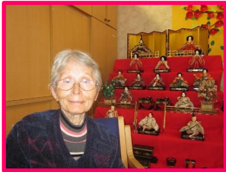
女性は飾るのが楽しい♪