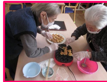
やっぱり手作りが一番!