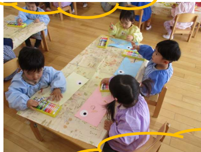
こいのぼりを作ったよ！