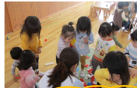
新しいブロックに興味津々！