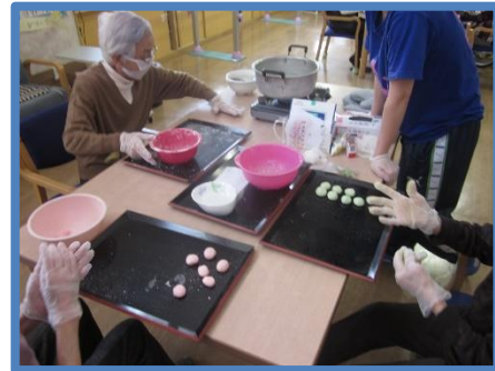
みんなで一緒に丸めます！