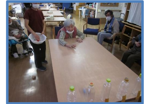
ソレっ！倒れるかな!?