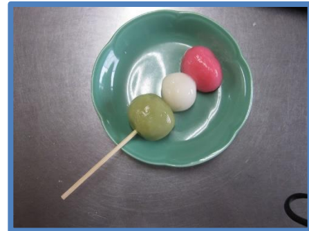
完成！おいしそうです♪