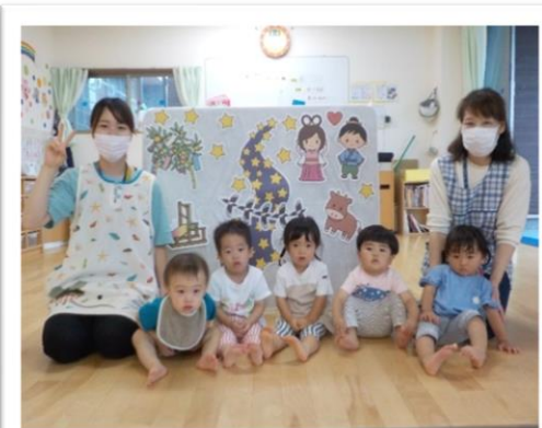
七夕会のペープサートの前で パシャリッ