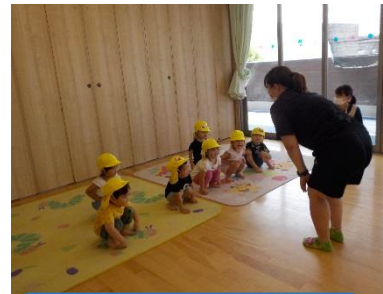
☆音楽教室☆ 音楽に合わせて歩いたり、動物の真似をして体を動かして楽しいね！