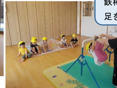
☆体育教室☆ 鉄棒にぶら下がったり、足を掛けたりしたよ。