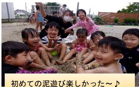
初めての泥遊び楽しかった～♪