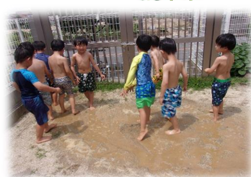
園庭で蜜柑さんと葡萄さんと泥遊びをしたよ！！