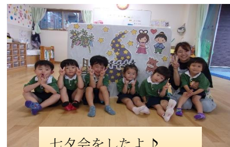
七夕会をしたよ♪ 願い事叶うといいな♪