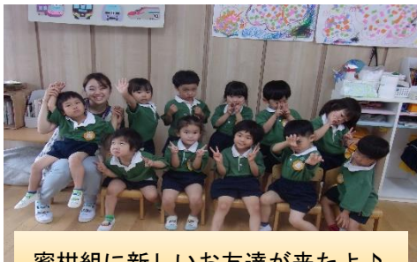
蜜柑組に新しいお友達が来たよ♪