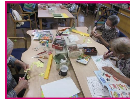
細かい作業は得意だよ！