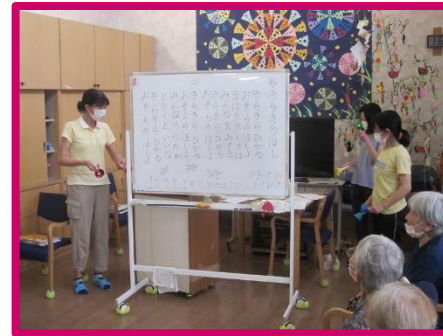
様々なイベントを行い大笑い