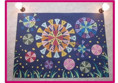
とってもきれいで見惚れます♪