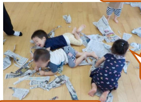
新聞紙の山にダイブ!