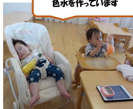
色水を作っています