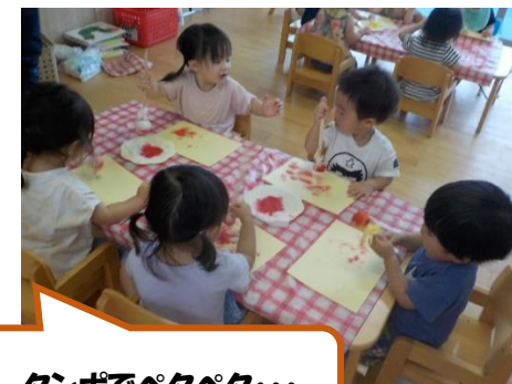
ダンポでペタペタ...