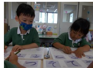
～ランチョンマット作り～

デイキャンプの制作の一つとして、皆で育てているピーマンとオクラの夏野菜を使ってランチョンマットを作りました。子ども達は「ねばねばしてきた」「ハートの形もある」などと断面図を観察しながら制作を楽しんでいました。個性豊かなランチョンマットができました。