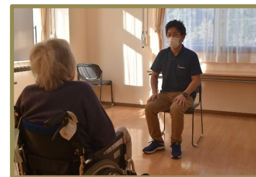
※こちらはイメージ写真になります。

11月より対面面会を再開しましたが、12月より予約方法が変更となります。毎週月曜日から、翌週の金曜日まで予約が取れるようにいたしました。まだ月一回のみなど制限はございますが、少しでも大切な時間を過ごして頂きたいと思っております。予約方法などは11月下旬に郵送しておりますのでご確認願います。※情勢に応じて変更の可能性があります。