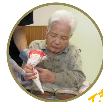
100歳になっても まだまだ元気！

ホットプレートを使用してみなさんでホットケーキを作りました。日頃提供させて頂くおやつと違って自分たちで作って好みの量をトッピングしてました。やっぱり手作りがおいしいですね♪