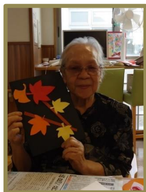
作品ができるとやっぱりうれしいですね