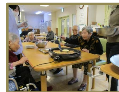
みなさん手際よく作っていきます♪