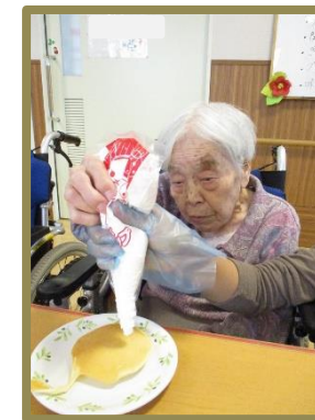
さあうまくトッピングできるかな!?

ホットプレートを使用してみなさんでホットケーキを作りました。日頃提供させて頂くおやつと違って自分たちで作って好みの量をトッピングしてました。やっぱり手作りがおいしいですね♪