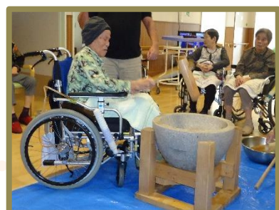
※過去の写真になります。

毎年恒例の餅つき大会。今年も各フロアで集まって皆さま一緒に餅つきを行い、今年は鏡餅も作る予定です。協力し合って来年に向けた準備を行いたいと思っております。