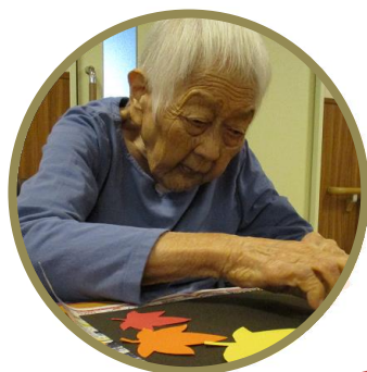
真剣なまなざしで 取り組みます

今年度から毎月皆さま集まって作品作りに取り組んでおり、継続すると毎月の楽しみが増えると喜んで頂けております。作品を飾って眺めるという生活の一部として今後も活動していきたいと思っております。