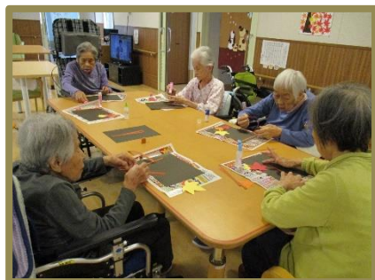
一緒に取り組むと楽しい！