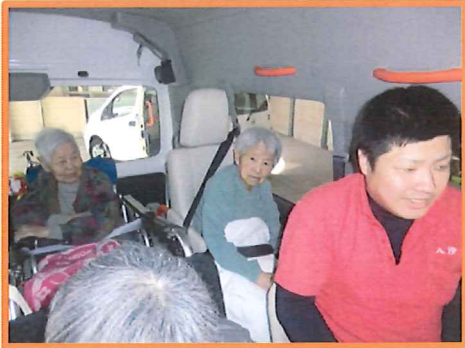
出発するときはウキウキ♪