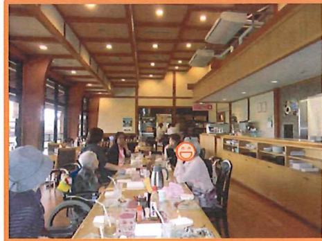
落ち着いた雰囲気がgood!