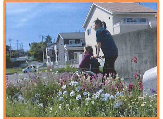
お茶をしたあと近くの公園を散歩しました♪