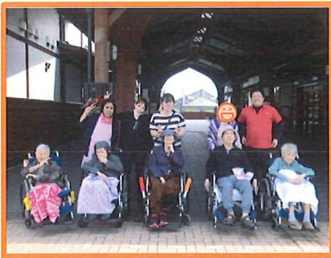
記念撮影は欠かせません!

入居者様から日頃より 「暖くなったら喫茶店に 行きたいがね～」と ご要望がありお出かけしました!