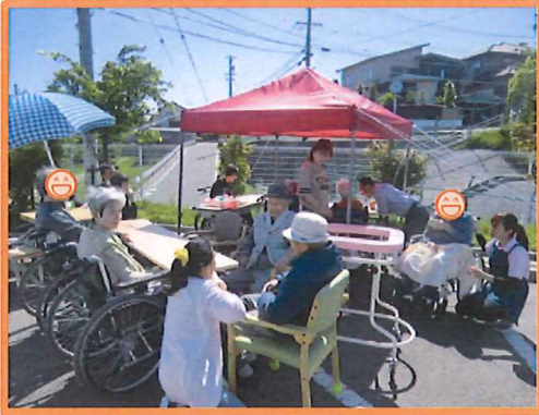
みんなでお出かけ気分♪