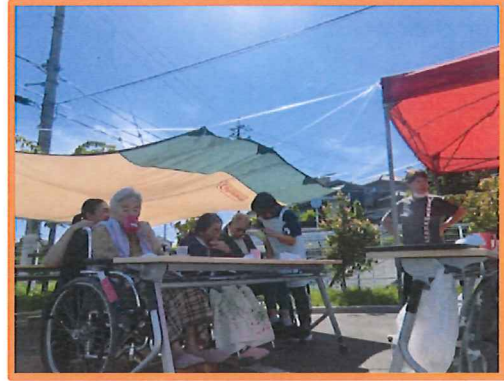
心地よい風が吹いていました！