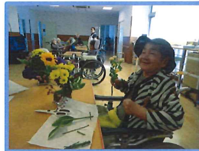
今回はどんなイメージ?

2Fのフロアで毎年恒例になってきました生け花レク。皆さまも楽しみにされていました。完璧を求めるわけではなくありのままの表現が楽しさにつながります。