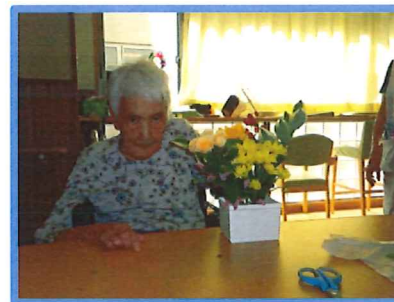
手を動かすと楽しい♪