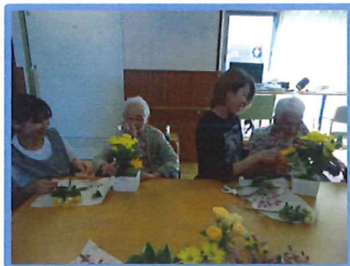
みんなでワイワイ賑やかに!

2Fのフロアで毎年恒例になってきました生け花レク。皆さまも楽しみにされていました。完璧を求めるわけではなくありのままの表現が楽しさにつながります。