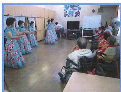
リズムが心地よいです♪