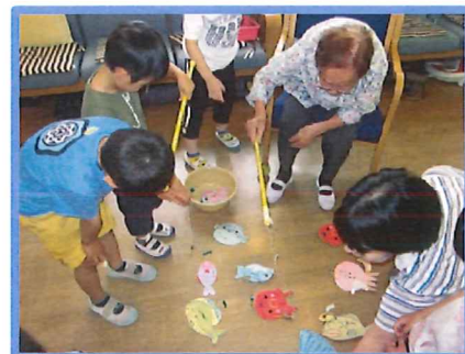
力まないのがコツかな!?