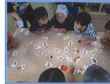
ボクも私も負けないよ～