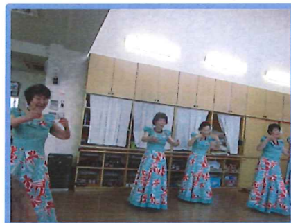
ダンサーの方々の笑顔もステキです！