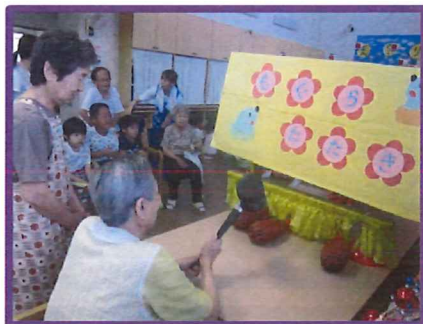
叩いてストレス発散!?