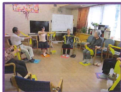
みんなで体操して体力UP!