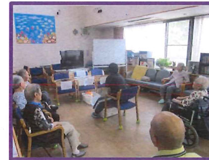
体操もゲームも楽しいが一番!