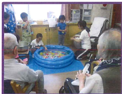
園児と一緒に楽しい♪