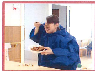
口には入らず！お決まりですね ※終了後、美味しくいただきました。