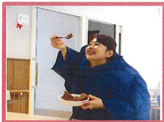
スプーンが上にあがって…

今年も各フロアの職員が余興などを行ってたくさん笑顔になっていただきました！演奏に合わせて一緒に歌ったり、二人羽織で笑いが止まらなかったり、楽しい時間でした。