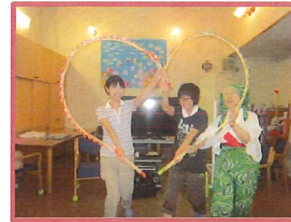
合わせてハート形になりました♪