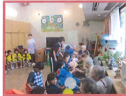
法被でお祭り気分♪