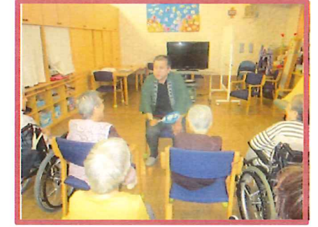
やっぱり話芸はおもしろい!