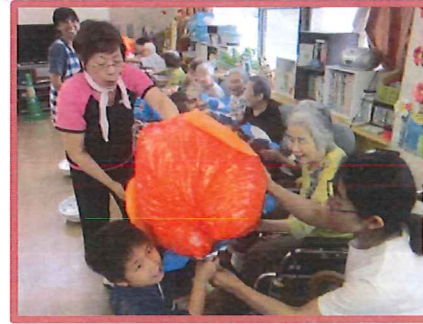
一緒に楽しめるのがイイ!