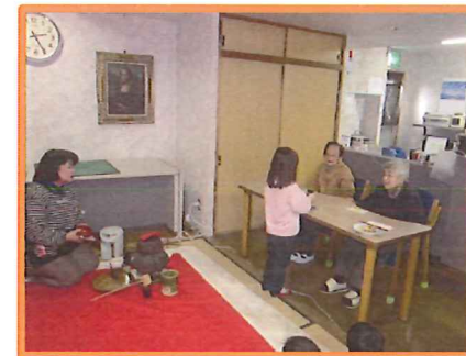
大人は心配でしょうがない!?