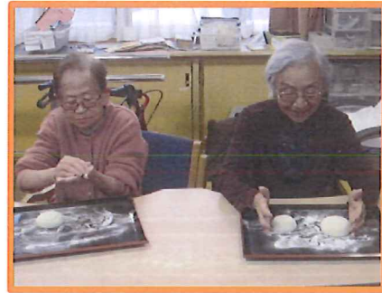
丸めて鏡餅を作りました♪