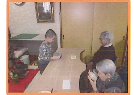
ちゃんと運べてー安心!