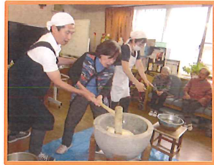
順番についていきます♪