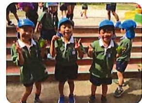
大きな茄子とピーマンを収穫しました！