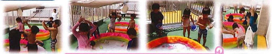
ペットボトルで頭から水をかぶったり、お友達と水をかけあう子、好きな玩具を集めて遊ぶ子など、それぞれの水遊びを楽しんでいました。