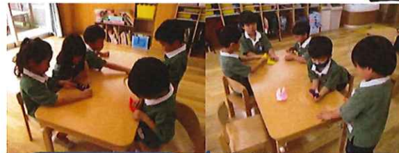
折り紙で船を折りました。お友達が迷っていると、優しく教えてくれる紫陽花さんです☆