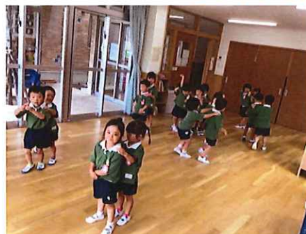
じゃんけん列車、楽しかったね★★