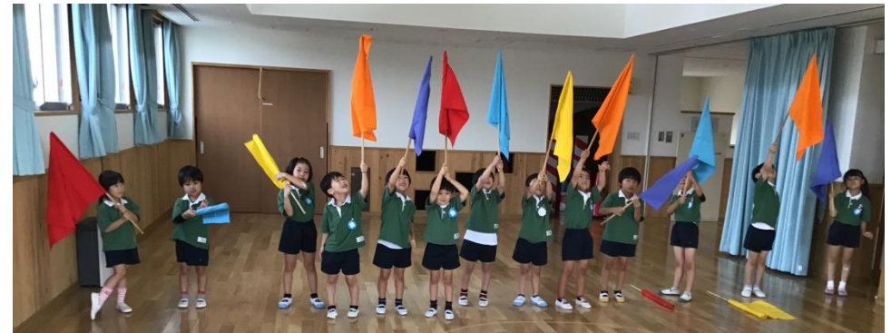
初めて持つ大きな旗に苦戦しながら、一生懸命、頑張りました！